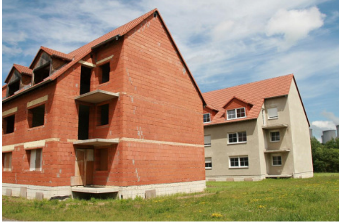
Grundstück in Hirschfelde