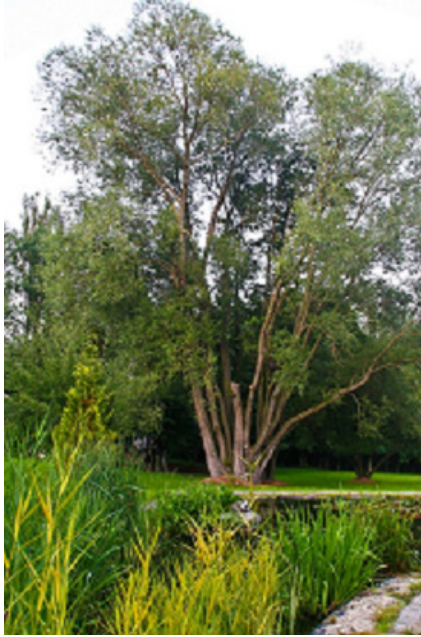
Naturngeschützte Parkanlage Halbendorfer Straße 02782 Seifhennersdorf