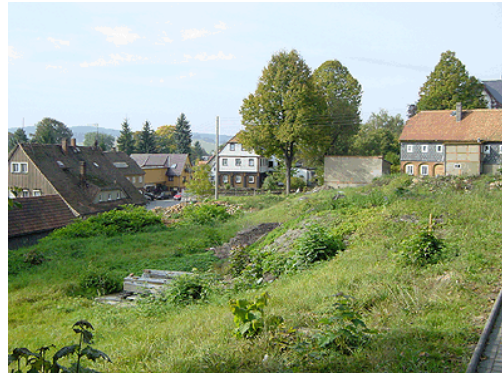
Grundstück in Seiffhennersdorf