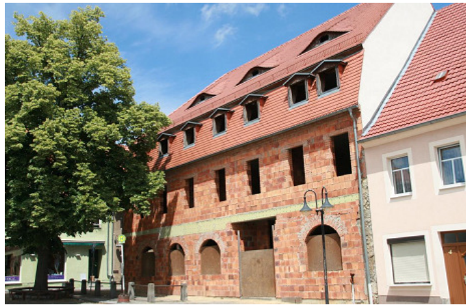
Grundstück in Bernstadt