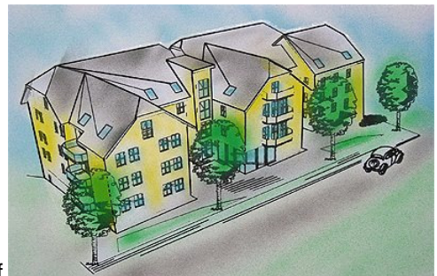
Objekt „Betreutes Wohnen“ in Seifhennersdorf