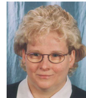
Beate Bartsch WebDesign