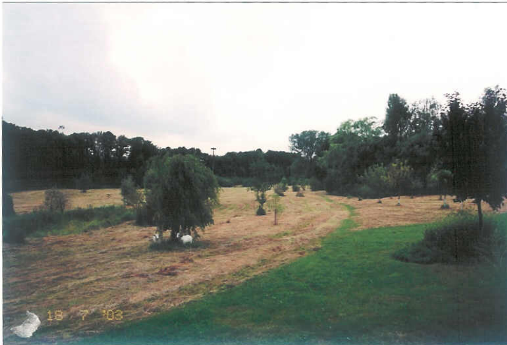
Naturschutzte Parkanlage Halbendorfer Straße 02782 Seifhennersdorf