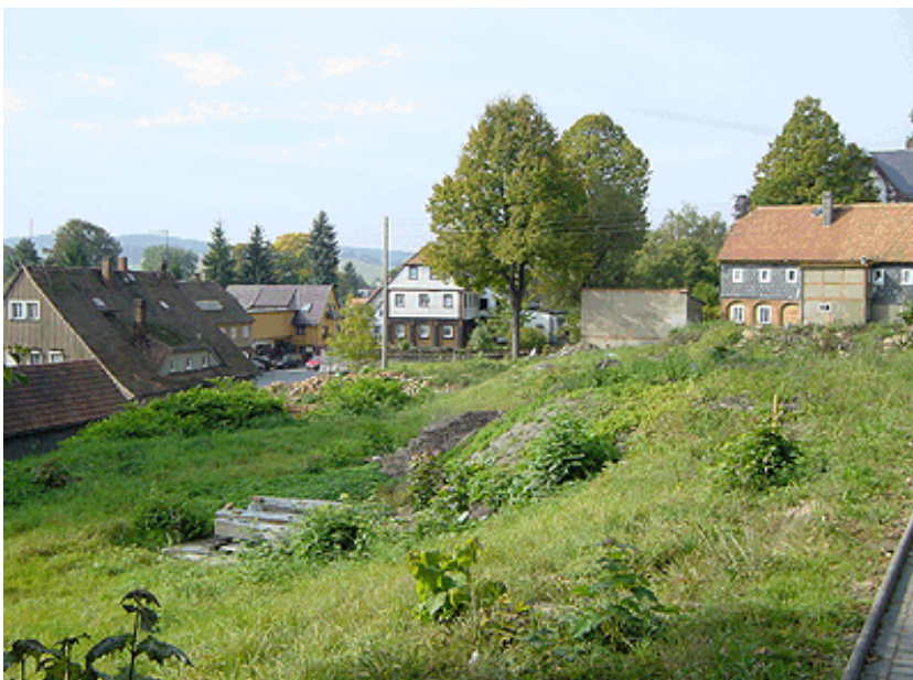
Grundstück in Seiffhennersdorf