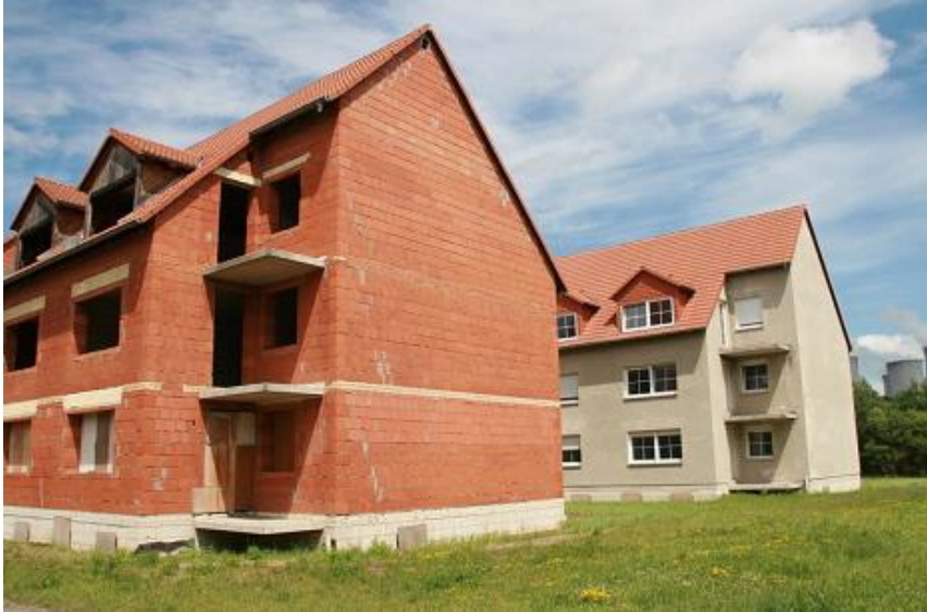
Grundstück in Hirschfelde