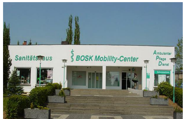
Nordstrasse 28 a