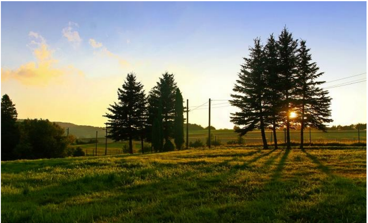
Naturngeschützte Parkanlage Halbendorfer Straße 02782 Seifhennersdorf