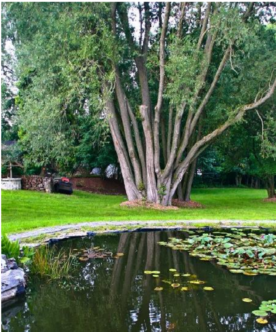
Naturschutzte Parkanlage Halbendorfer Straße 02782 Seifhennersdorf