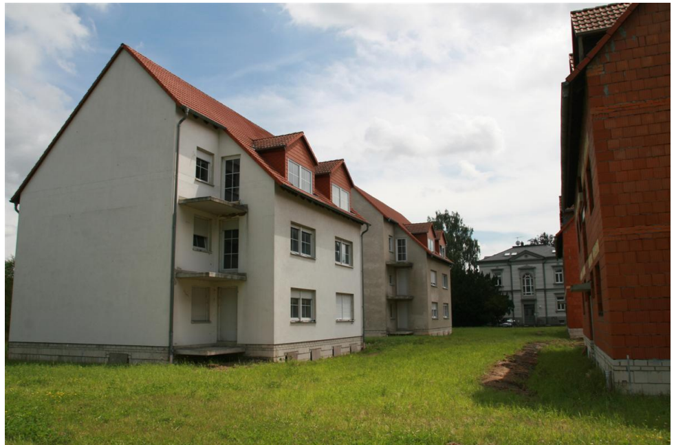
Grundstücke in Hirschfelde