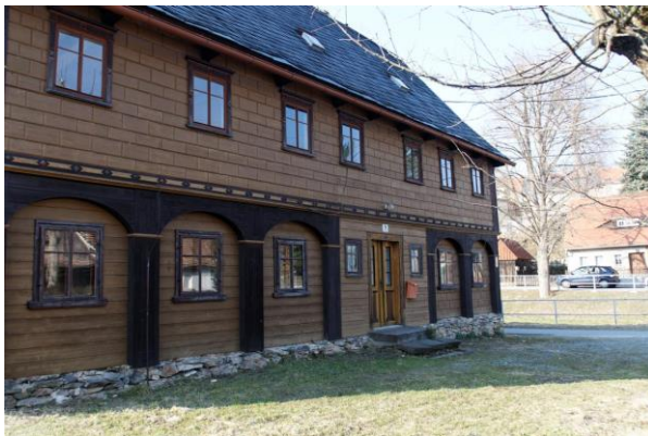
Objekt Uferweg 9