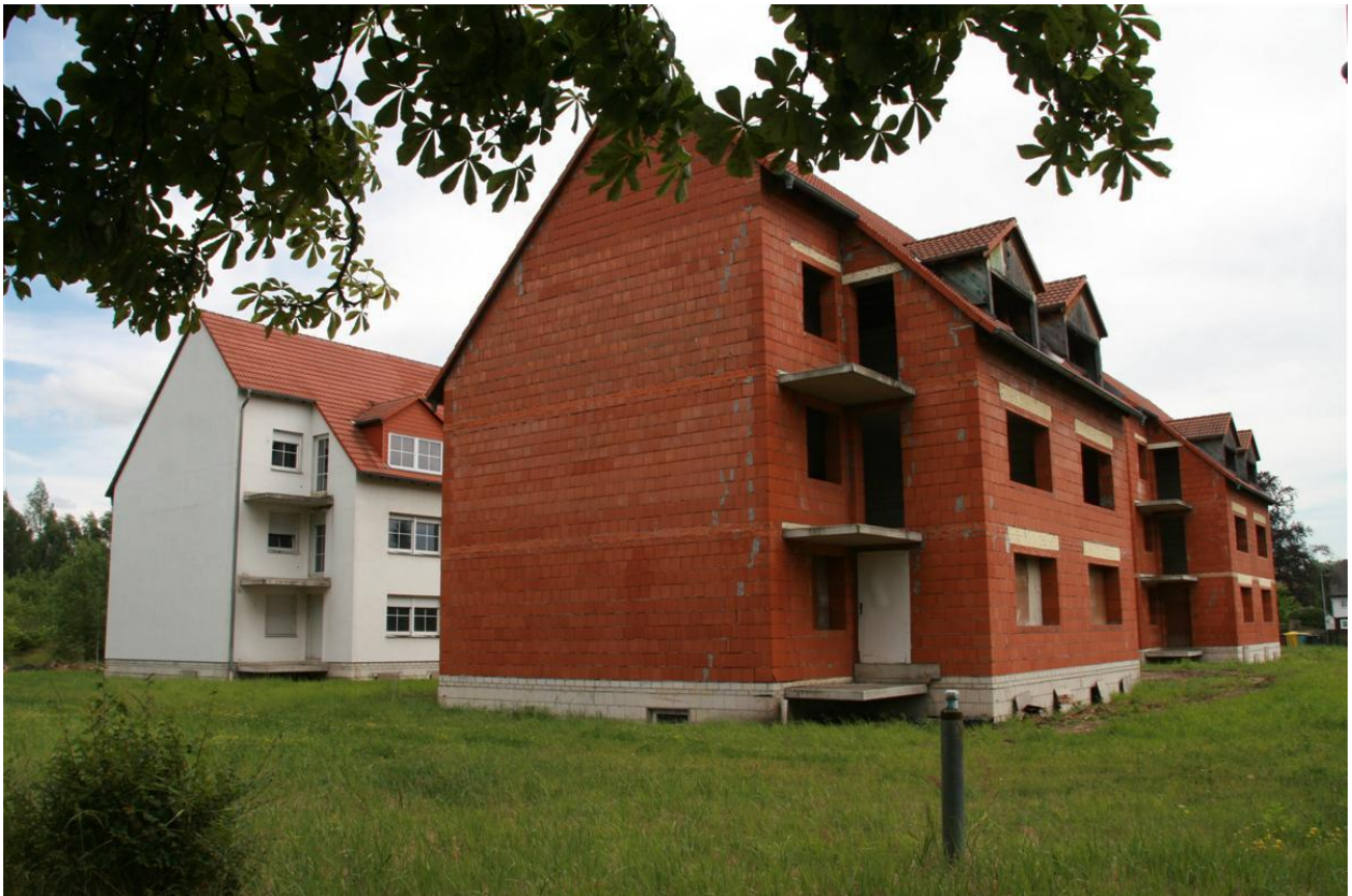
Grundstück Hirschfelde, Göthestraße 1