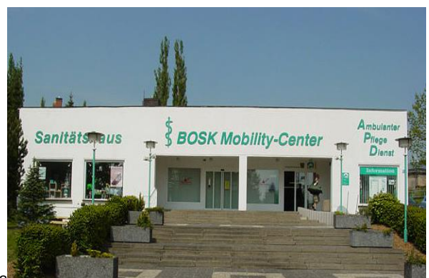
Nordstrasse 28 a