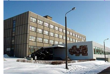
Spitzkunnersdorfer Straße 8