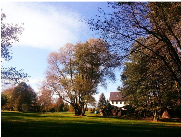
Objekt Halbendorfer Str. 17