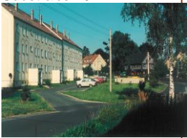
Eigentumswohnung in der Südstraße 19 F