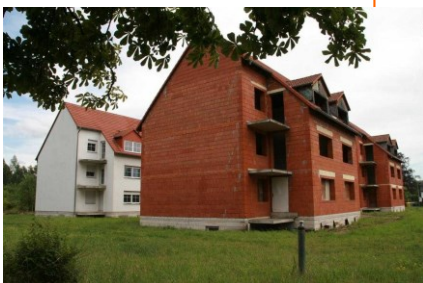
Goethestraße 1, Hirschfelde - Projekt Dementen WG / Betreutes Wohnen