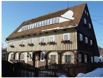
Uferweg 7 - Projekt Soziale Mitarbeiterwohnung 5WE