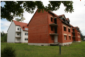
Projekt Betreutes Wohnen "NeiStalblick" Hirschfelde