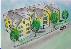
Projekt Betreutes Wohnen Nordstraße 35