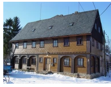
Halbendorfer Str. 17 - Projekt Kinderhospitz