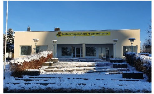
Projekt Betreutes Wohnen u. Ärztehaus Nordstraße 33-35