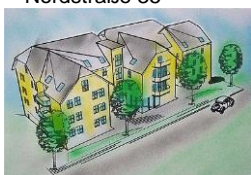
Projekt Betreutes Wohnen Nordstraße 35