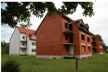
Goethestraße 1, Hirschfelde - Projekt Dementen WG / Betreutes Wohnen