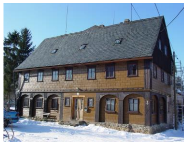
Uferweg 9 - Projekt Soziale Mitarbeiterwohnung 5 WE