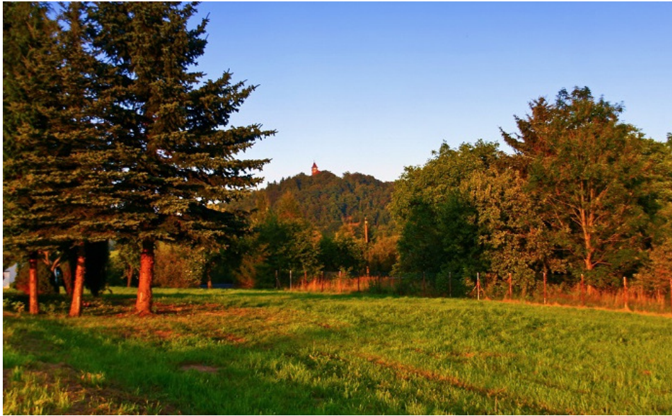
Naturngeschützte Parkanlage Halbendorfer Straße 02782 Seifhennersdorf