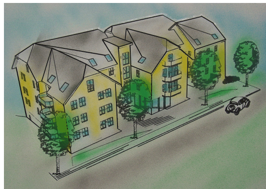
Grundstück in Seiffennersdorf