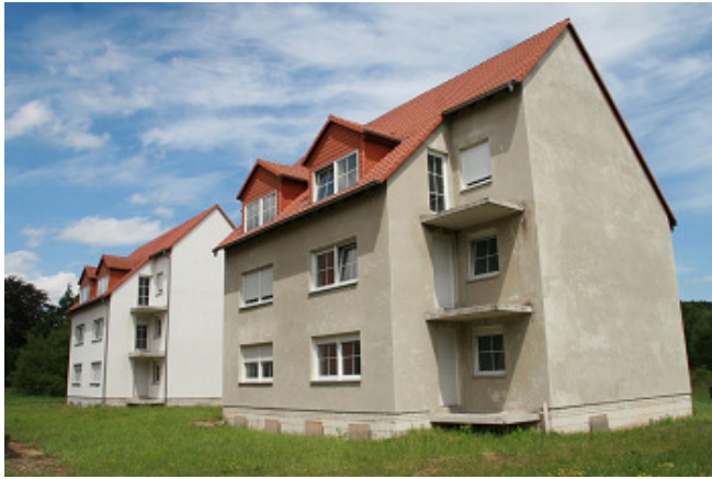
Grundstück in Hirschfelde