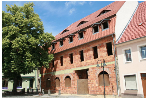
Grundstück in Bernstadt