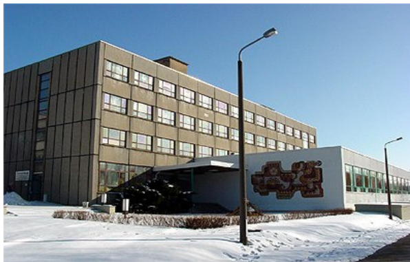
Verwaltungsgebäude Spitzkunnersdorfer Str.