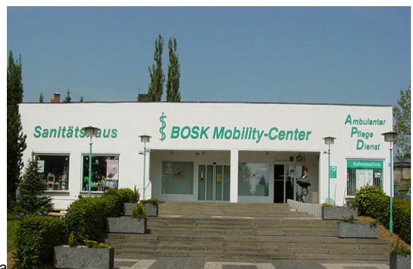
Nordstrasse 28 a