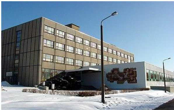
Verwaltungsgebäude Spitzkunnersdorfer Str. 8