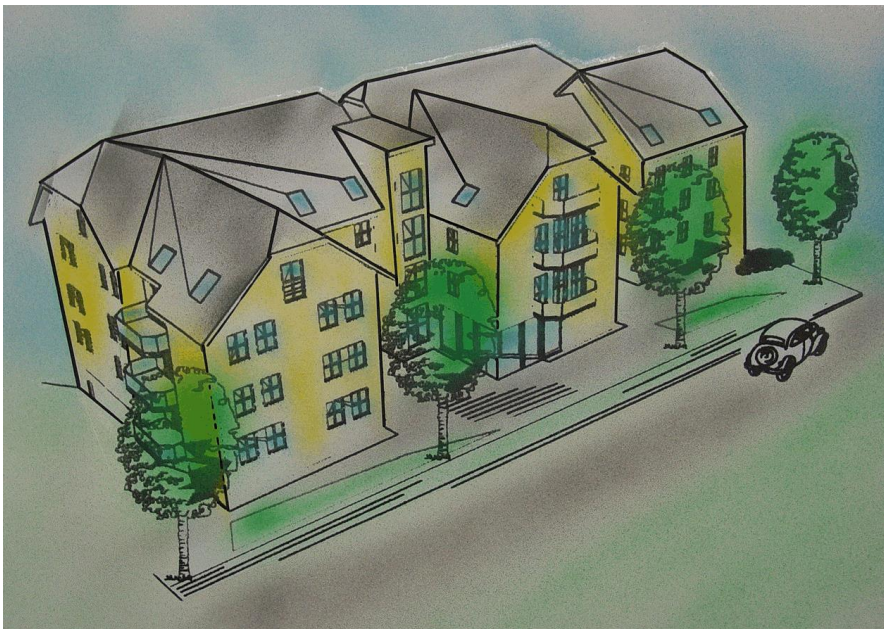
Betreute Wohnanlage in Seifhennersdorf