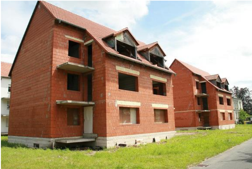
Grundstücke in Hirschfelde