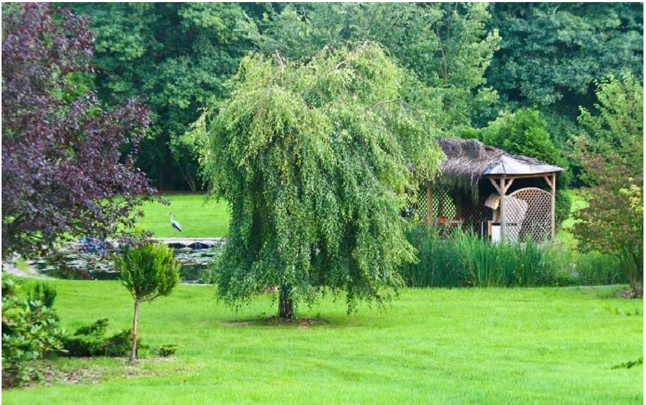
Naturngeschützte Parkanlage Halbendorfer Straße 02782 Seifhennersdorf