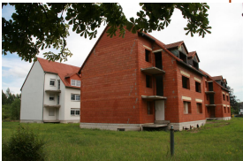
Projekt Betreutes Wohnen "NeiStalblick" Hirschfelde